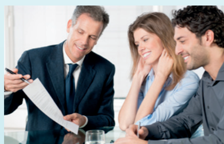
Verbrauchserfassung- und Abrechnung